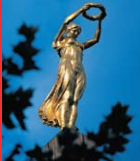
[10a] “Gëlle Fra”, Place de la Constitution