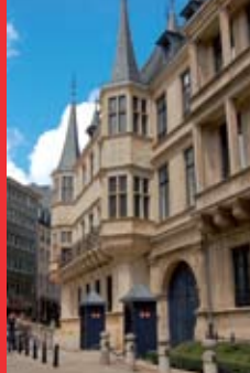
[2] Palais grand-ducal