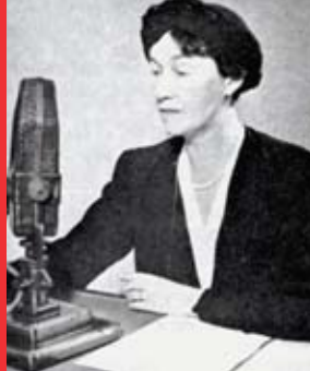
[8b] Allocution radiophonique sur la BBC