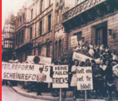
[3b] Manifestation de femmes devant le Parlement, 1972