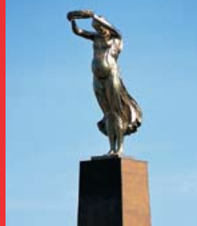
[10b] “Lady Rosa” enceinte