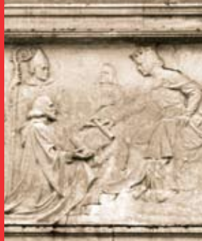
[1a] Frise d'Ermesinde