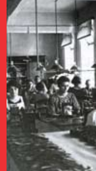
[6c] Ouvrières de l'industrie textile

avec le rocher et le fort Lucilinburhuc, épousa une créature fabuleuse du nom de Mélusine [4b]. Pétri de jalousie, il rompit la promesse faite à sa femme de ne jamais la voir le samedi et découvrit alors qu'elle portait une queue de poisson. Sur ces entrefaites, Mélusine disparut dans les flots de l'Alzette et n'a plus jamais été revue jusqu'à ce jour. Au 19 e siècle, cette légende provenant à l'origine du Poitou (F) fut traduite en luxembourgeois et Mélusine devint la "mère" de la dynastie, de la ville et de la nation. On peut voir son portrait sur l'un des piliers du Palais (vers 1895) ainsi que sur un des vitraux de la cathédrale (1935-38).