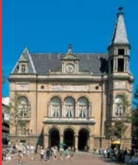
[1] Cercle municipal