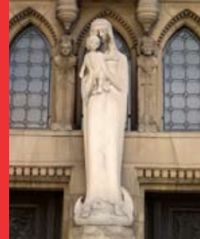
[9a] La Vierge et l'enfant Jésus à sa gauche Cunégonde