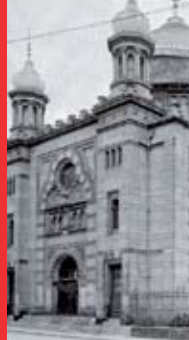
[11] L'ancienne synagogue, 1930