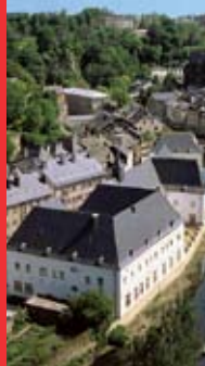
[6a] Ancienne prison pour femmes