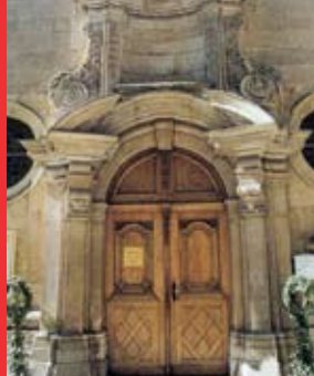
[7b] Portail de l'église de la Trinité