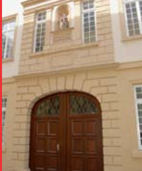
[7a] Ancien refuge des bénédictins