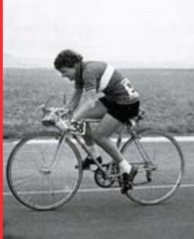
[14a] La championne du monde de vélo Elsy Jacobs