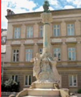
[12a] Monument Dicks-Lentz