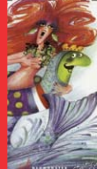
[4b] L'ondine Mélusine

Marguerite d'Autriche [2a] (1480-1530) et Marie de Hongrie [2b] (1505-1558), les Pays-Bas ont connu une apogée économique et culturelle. Alors que les femmes étaient presque toujours exclues de la succession au trône, l'impératrice Marie-Thérèse [2c] (1717-1780) parvint à s'imposer par les armes (Guerre de succession d'Autriche). Elle mit ensuite en œuvre des réformes importantes, dont un cadastre des domaines de ses sujets en vue de moderniser l'administration et de réduire les privilèges fiscaux de l'aristocratie. Le bâtiment du Palais actuel fait non seulement le lien avec les femmes au sommet du pouvoir mais également – en tant que lieu de jurisprudence et cour d'appel – avec les femmes accusées de sorcellerie et mises au ban de la société. Ainsi, pendant l'époque moderne (1500-1800), le Duché de Luxembourg connut environ 2 000 procès en sorcellerie. On estime qu'à travers toute l'Europe 50 000 personnes auraient été envoyées au bûcher, dont la moitié dans le Saint-Empire romain de la nation germanique, auquel appartenait autrefois le Luxembourg.