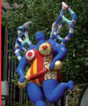
[15a] Niki de Saint Phalle “La grande Tempérance”