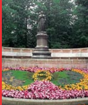
[13] Monument de la princesse Amélie