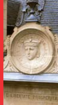
[4a] Médaille d'Ermesinde