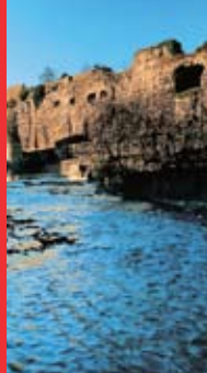
[4] Rocher du Bock