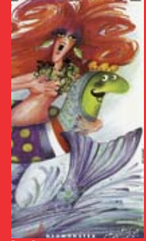
[4b] Fabelwesen Melusina

Frauen waren von der Thronfolge meist ausgeschlossen. Eine Ausnahme bildete Kaiserin Maria Theresia [2c] (1717-1780). Sie konnte sich in den so genannten Erbfolgekriegen militärisch behaupten und setzte später wichtige Reformen durch. So ließ sie ein Kataster der Güter ihrer Untertanen aufstellen, um die Verwaltung zu modernisieren und die Steuerprivilegien der Adligen einzuschränken. Das Gebäude des heutigen Palastes stellt nicht nur die Verbindung zu Frauen an der Spitze der Macht her, sondern auch – als Ort der Rechtsprechung und des Berufungsgerichts – zu Frauen, die, der Hexerei bezichtigt, von der Gesellschaft verstoßen wurden. Ein düsteres Kapitel der frühen Neuzeit (1500-1800) sind die circa 2 000 Hexenprozesse, die im Herzogtum Luxemburg stattfanden. In Gesamteuropa wird die Zahl der Hexenverbrennungen auf 50 000 geschätzt, davon circa die Hälfte im Heiligen Römischen Reich Deutscher Nation, zu dem Luxemburg damals gehörte.