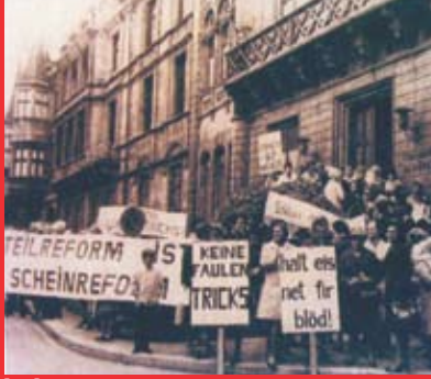
[3b] Frauendemo vor dem Parlament, 1972