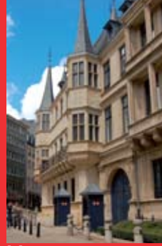
[2] Großherzoglicher Palast