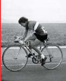
[14a] Radweltmeisterin Elsy Jacobs