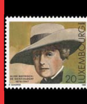
[7d] Aline Mayrisch – de Saint-Hubert

ging die weibliche Beschäftigungsquote seit Anfang des 20. Jahrhunderts zurück. Erst ab den sechziger Jahren stieg sie wieder an, liegt jedoch heute noch unter dem europäischen Durchschnitt.