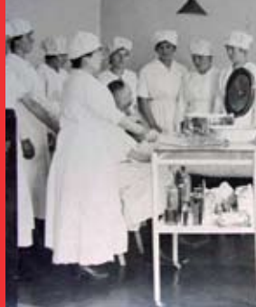
[5a] Hebammen, Pfaffenthal um 1935