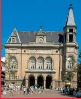
[1] Cercle Municipal