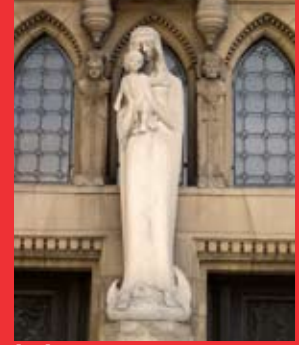
[9a] Maria mit dem Jesuskind, links von ihr Kunigunde

Dynastie, war nach dem Ersten Weltkrieg eine angespannte politische Situation entstanden. Auf Druck der antimonarchistischen Bewegung dankte Großherzogin Marie-Adelheid zu Gunsten ihrer jüngeren Schwester ab. Beim Referendum vom 28.9.1919 sprach sich die überwältigende Mehrheit für die Erhaltung der Monarchie unter der neuen Großherzogin aus. Während des Zweiten Weltkriegs wurde Charlotte durch ihre diplomatischen Bemühungen und ihre Radioansprachen auf BBC [8b] schnell zu einer Ikone des Luxemburger Widerstands und zur Personifizierung des Unabhängigkeitswillens.