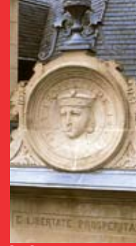
[4a] Ermesinde Medaillon