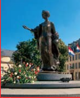
[8a] Place Clairefontaine, Denkmal Ghz. Charlotte